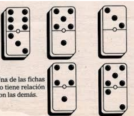
Una de las fichas no tiene relación con las demás.