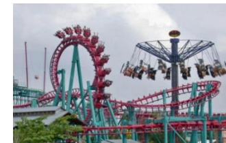
Montaña rusa y carrusel del parque de atracciones de Madrid.

Durante este tiempo disfrutaron a lo máximo subiéndose a todas las atracciones todo ello pese al mal tiempo, el viaje resultó