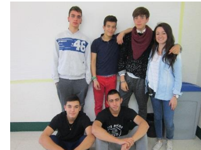
Algunos miembros de Campus Today en la redacción.

La primera edición del periódico semanal de Campus Unidos al fin ve la luz. En él, residentes y profesionales se encargarán de mantener actualizadas todas las novedades acontecidas en nuestro centro terapéutico. Noticias de interés y novedades de nuestro día a día serán recogidas en este espacio. También queremos ofrecer un lugar para informar sobre las actividades deportivas y