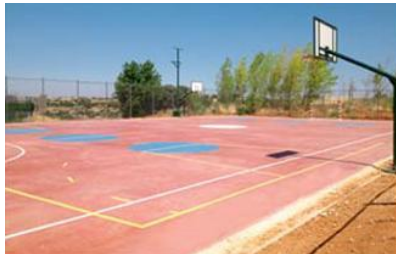
Pista deportiva de los Olivos dónde se practican la mayoría de los deportes en Campus Unidos.

semanalmente de comentar los goles, jugadas y mejores paradas de nuestros jugadores.