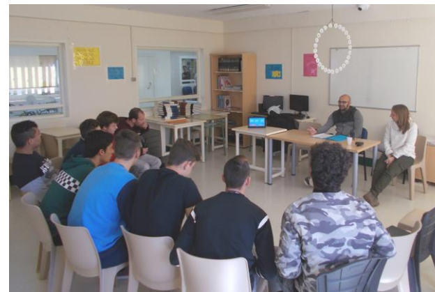
Los chicos de Europa ante el “rosco” final de Pasapalabra